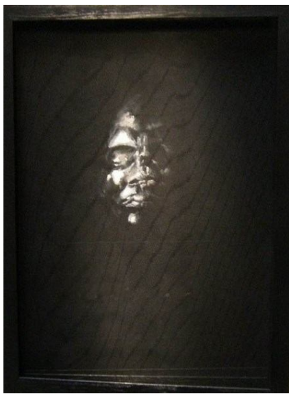
"The riddle of the painting"